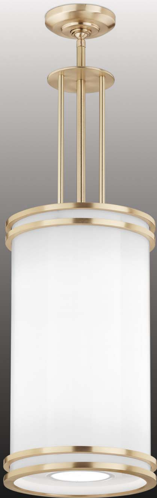
elements series P2159 acrylic diffuser