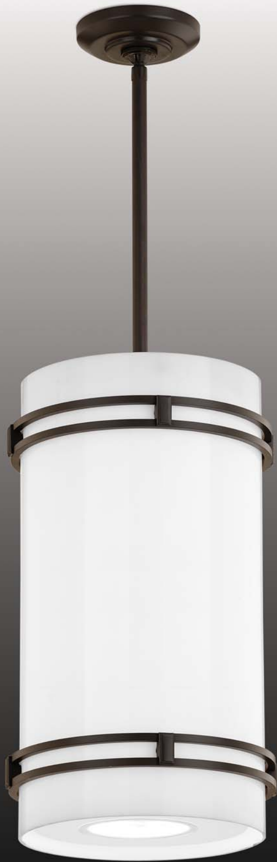
signature series P3118 acrylic diffuser