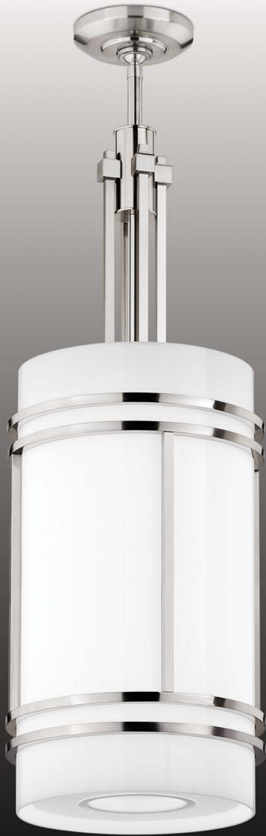
signature series P3318 acrylic diffuser